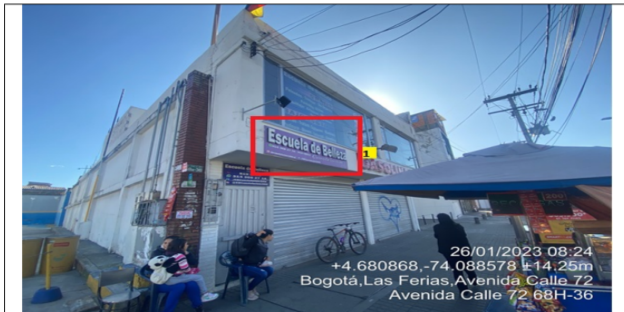
En la cual se evidencia un (1) elemento tipo aviso en fachada perteneciente al establecimiento comercial ESCUELA DE BELLEZA CONSTELACIÓN 2000 propiedad de la sociedad CONSTELACIÓN 2000 LTDA , el cual al momento de la visita se encontraba instalado sin el registro ante la SDA.