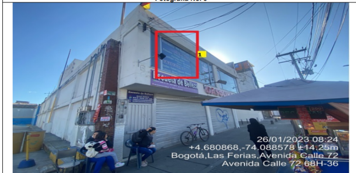
En la cual se evidencia un (1) elemento publicitario perteneciente al establecimiento comercial ESCUELA DE BELLEZA CONSTELACIÓN 2000 propiedad de la sociedad CONSTELACIÓN 2000 LTDA , el cual se encuentra incorporado en las ventanas de la edificación y es adicional al único elemento permitido por fachada de establecimiento comercial.