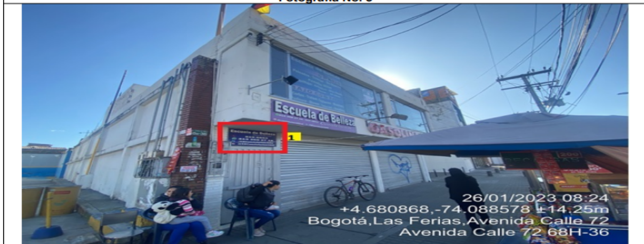
Fotografía No. 5

En la cual se evidencia un (1) elemento tipo aviso en fachada perteneciente al establecimiento comercial ESCUELA DE BELLEZA CONSTELACIÓN 2000 propiedad de la sociedad CONSTELACIÓN 2000 LTDA , el cual es adicional al único elemento permitido por fachada de establecimiento comercial.